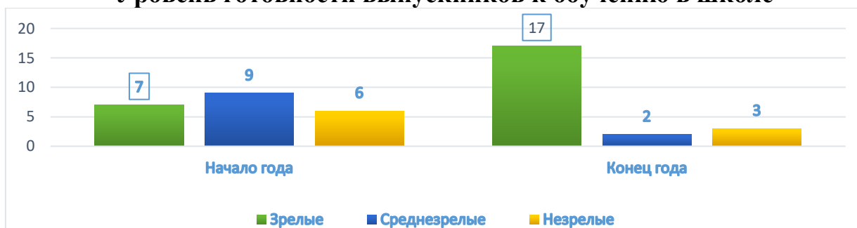
Уровень готовности выпускников к обучению в школе

Следовательно, анализируя результаты мониторинга можно сделать вывод, что большая часть выпускников Учреждения готова к обучению в школе.